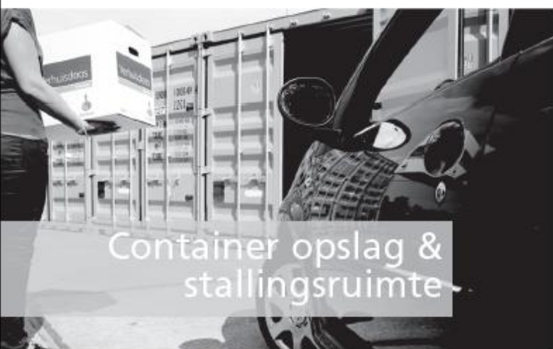
Container opslag & stallingsruimte