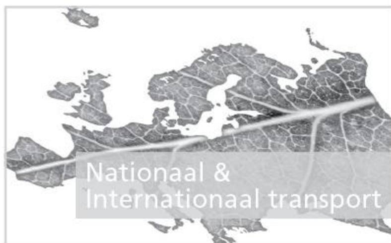
Nationaal & Internationaal transport